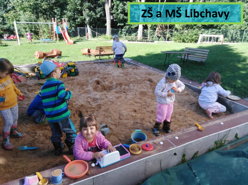
ZŠ a MŠ Libchavy