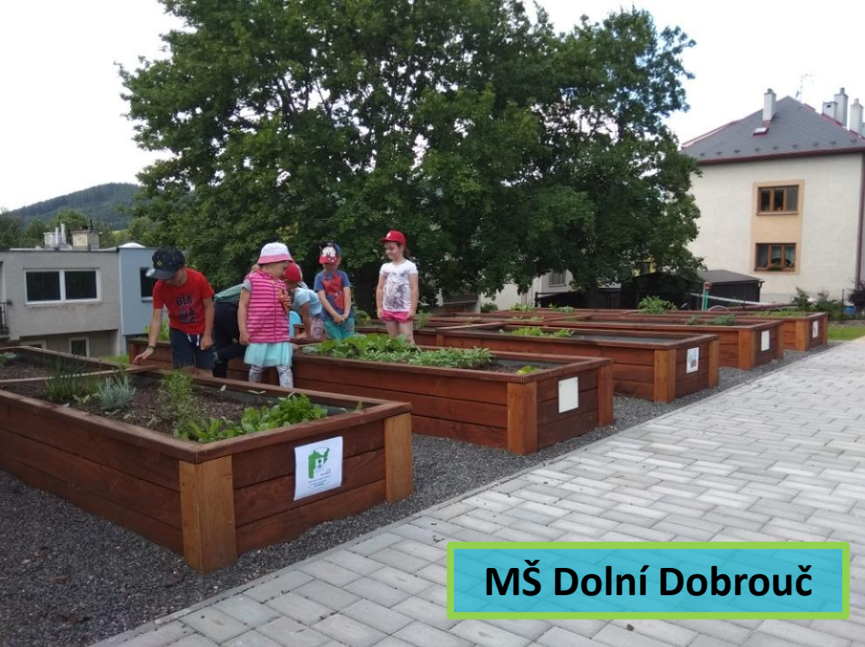
MŠ Dolní Dobrouč