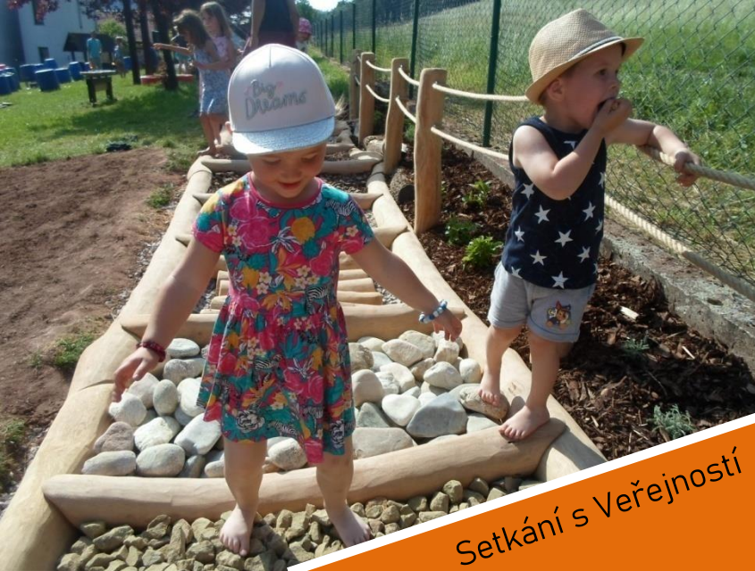
Setkání s Veřejností