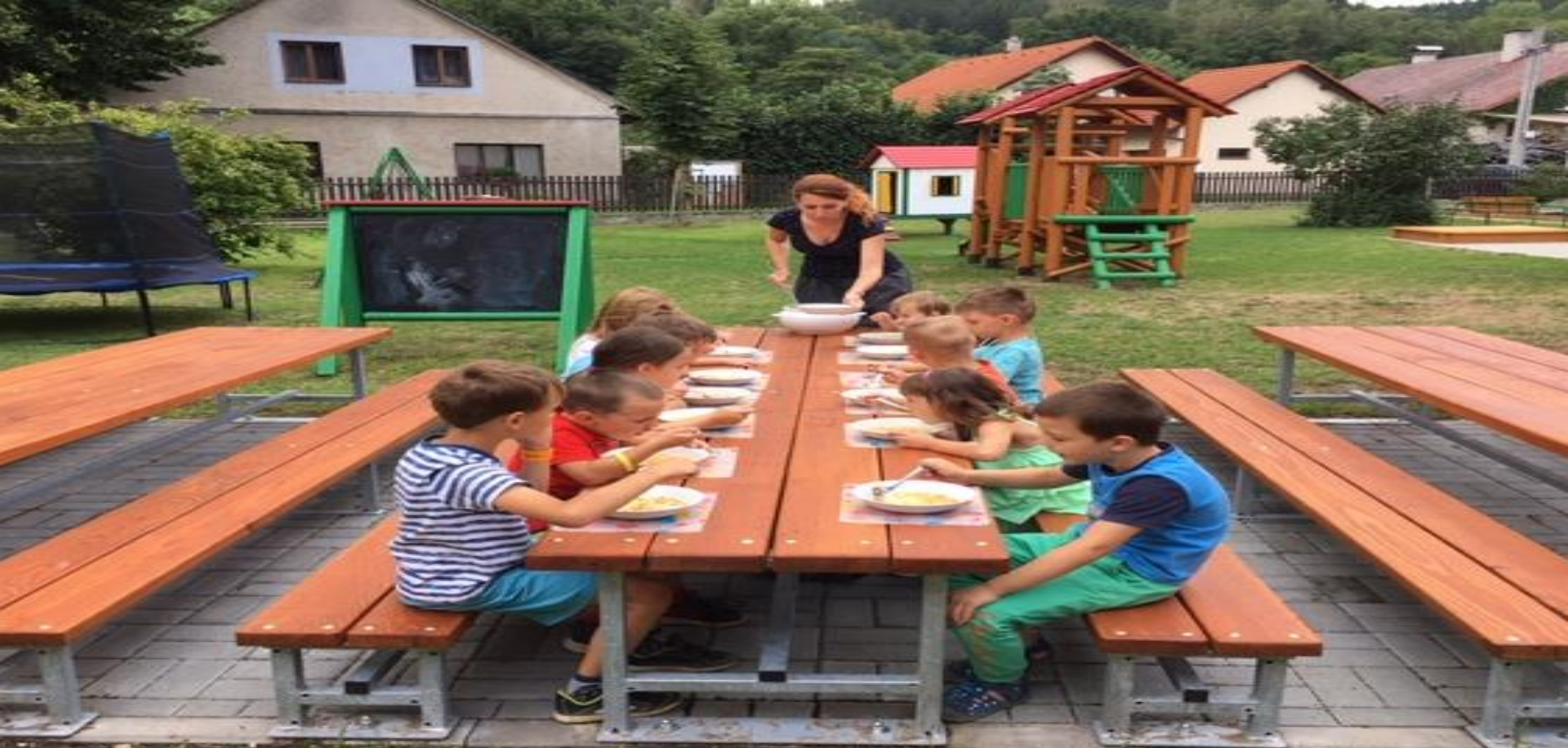
Zapojená mateřská škola: Mateřská škola Ústí nad Orlicí, Sokolská - návrh změn