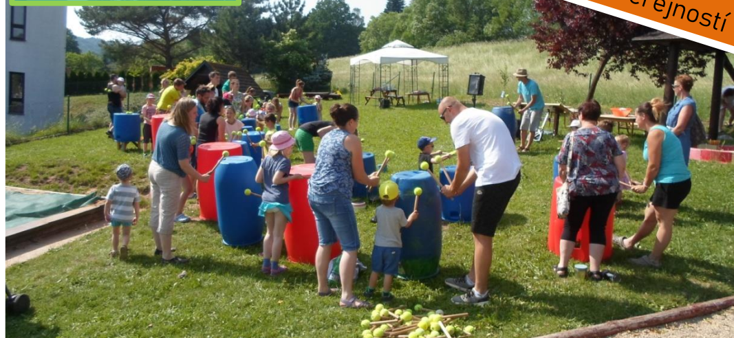
Setkání s Veřejností