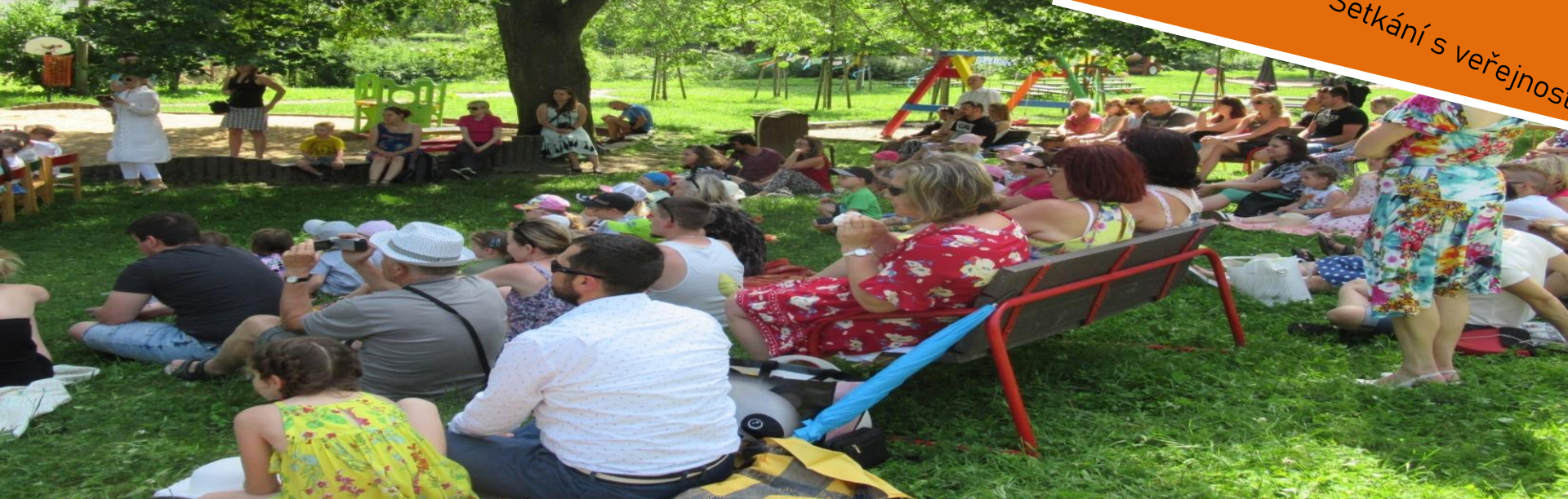
Setkání s veřejností