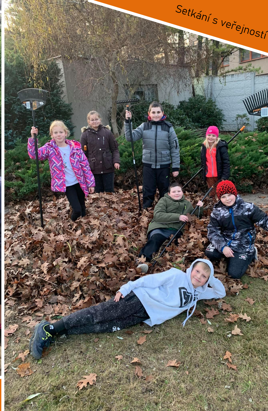
Setkání s veřejností