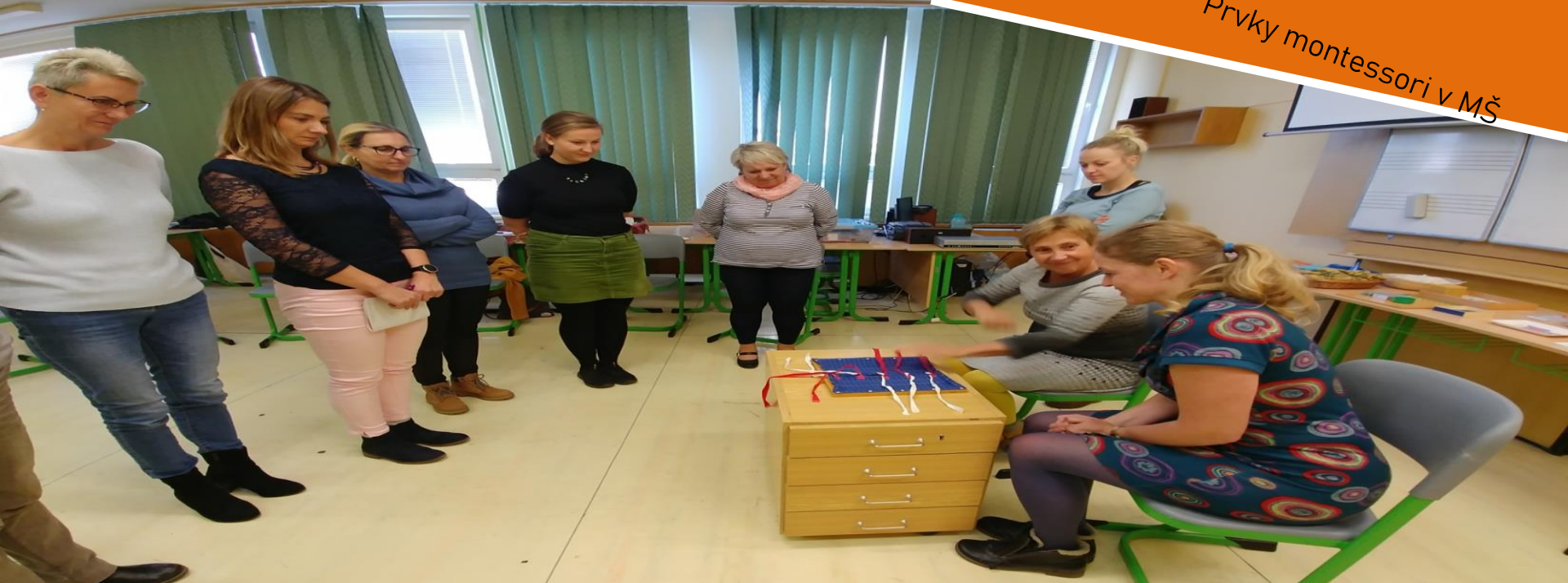
Prvky montessori v MŠ