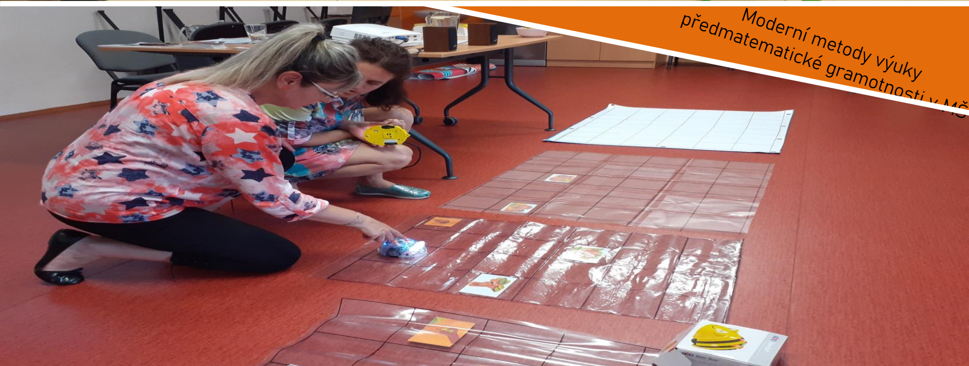
Moderní metody výuky předmatematické gramotnosti v MŠ