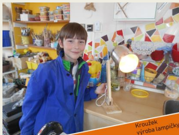
Kroužek výroba lampičky

Co v rámci projektu vzniklo: Dostupný zájmový kroužek pro děti do 15 let zaměřený na rozvoj technických dovedností a manuální zručnosti dětí Přiblížení světa techniky atraktivní zájmovou činností Naplnění požadavků po volnočasovém kroužku zaměřeném na manuální práci Rozvoj schopností a dovedností dětí pro jejich budoucí povolání, či běžný život Rozvoj profesních kompetencí pracovníků ve vzdělávání Sdílení zkušeností a příkladů dobré praxe s ostatními pracovníky ve vzdělávání