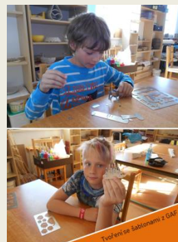
Tvoření se šablonami z GAF