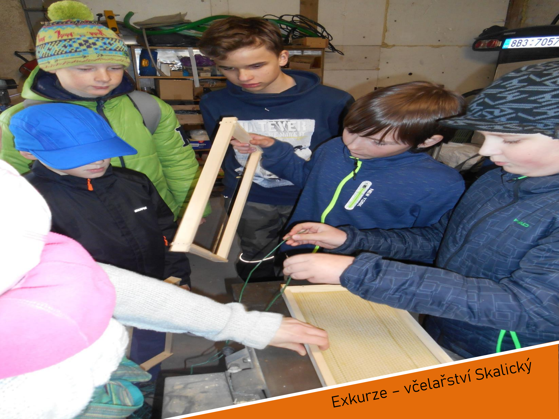
Exkurze – včelařství Skalický