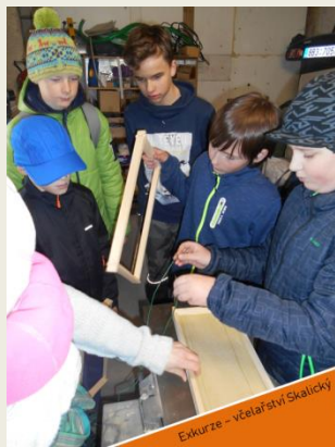
Exkurze - včelařství Skalický