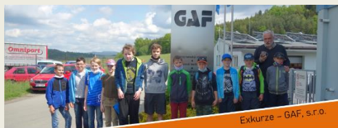
Exkurze - GAF, s.r.o.