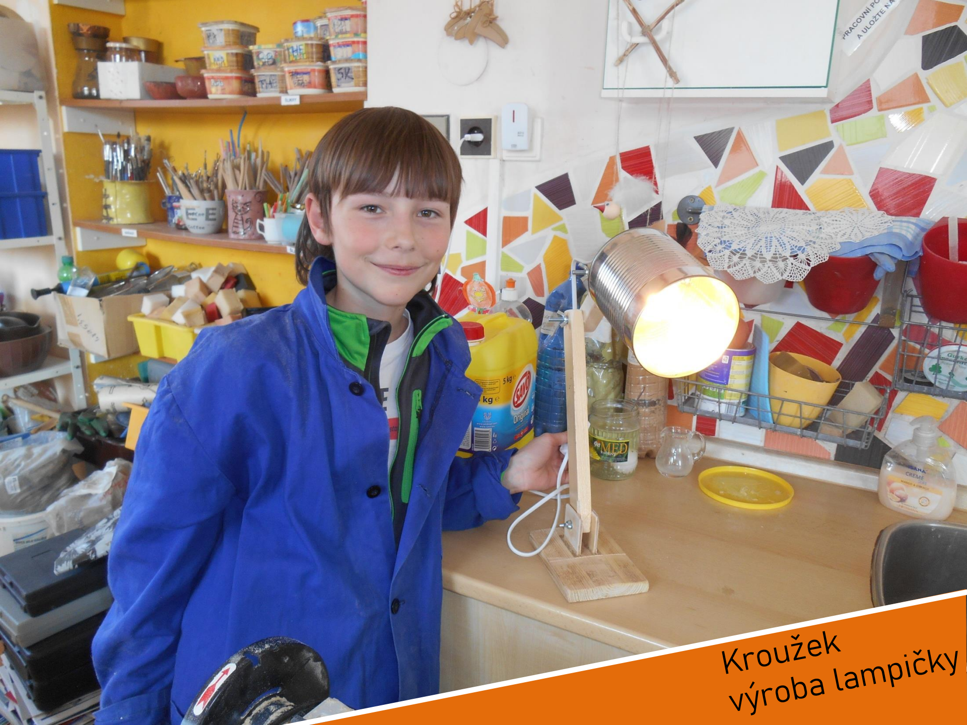
Kroužek výroba lampičky