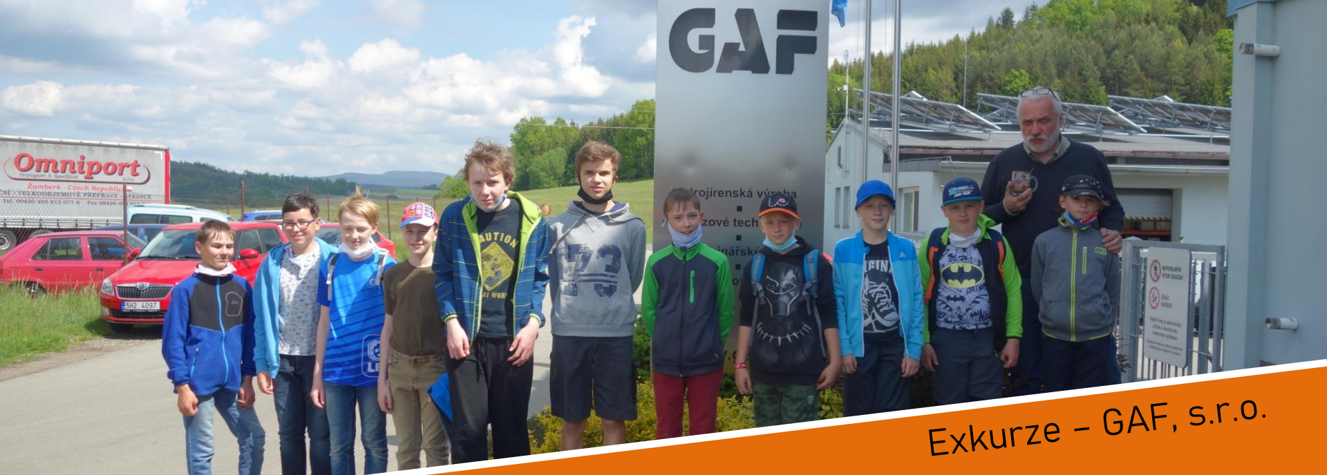
Exkurze – GAF, s.r.o.