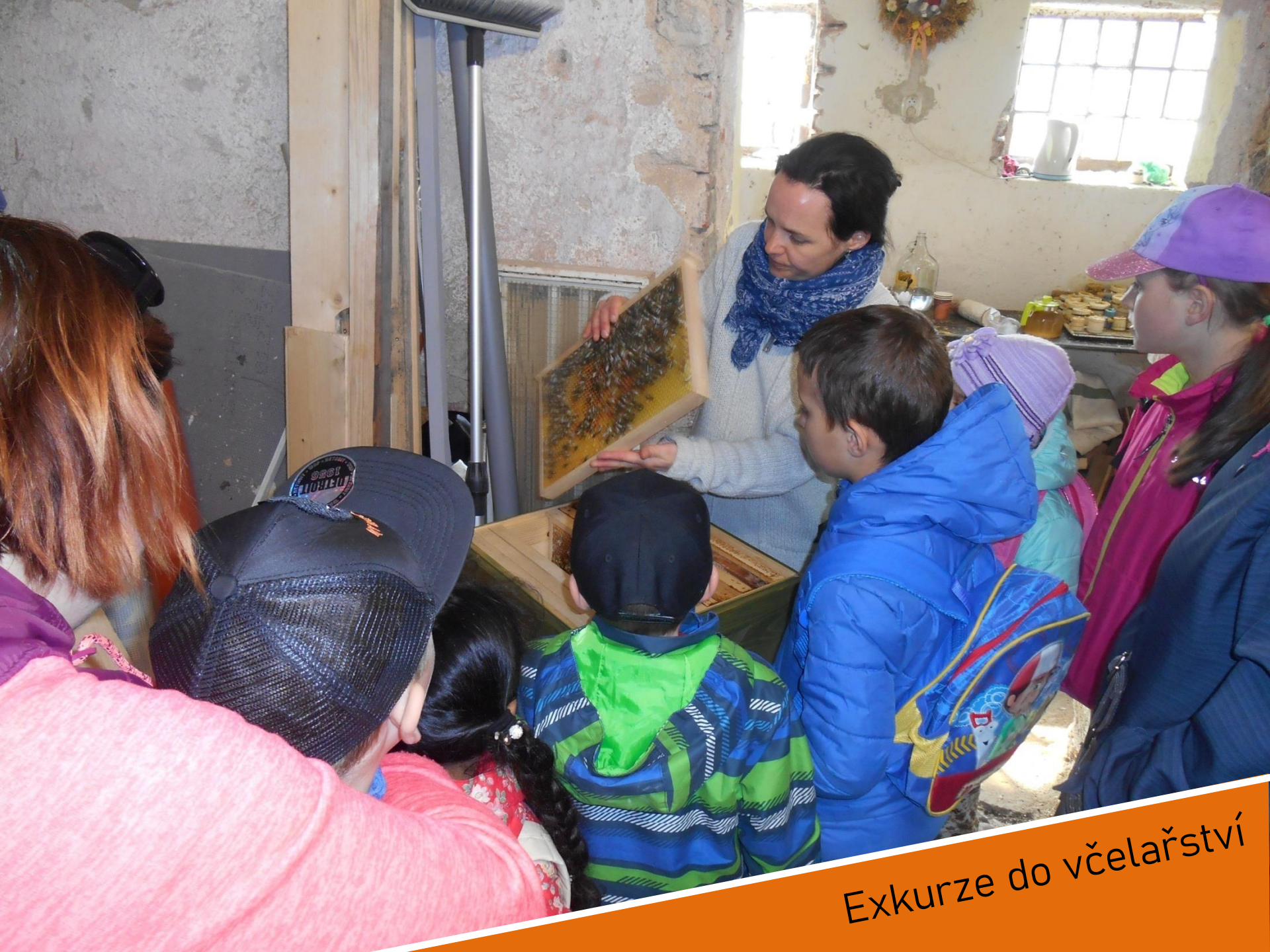
Exkurze do včelařství